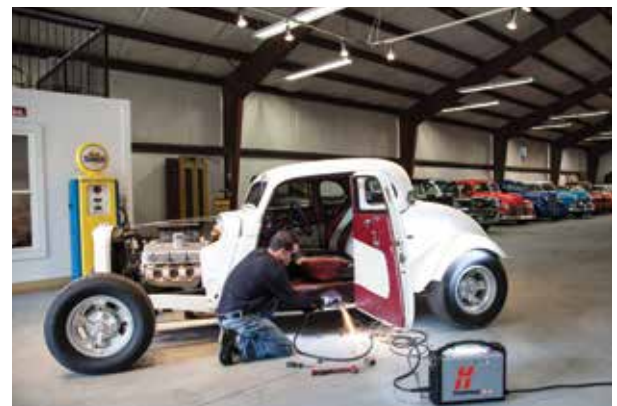
Fahrzeugreparatur und -umbau