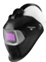
Abb.: 3M™ Speedglas™ Automatikschweißmaske 100-QR